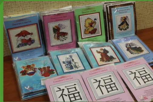
Интернет-магазин «Клубок желаний» - Наборы для вышивания 29 шт.