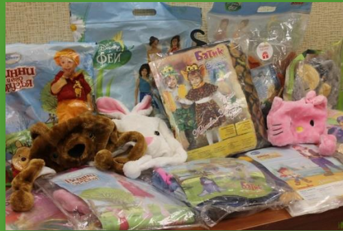
ИП Романов Д. Е. - Карнавальные костюмы и шапки с животными 20 шт.