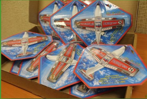
АО «Тулиновский приборостроительный завод «ТВЕС» - Игрушечные самолеты 10 шт.