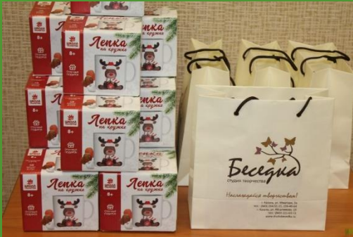
Студия творчества «Беседка» – Наборы для творчества 24 шт.