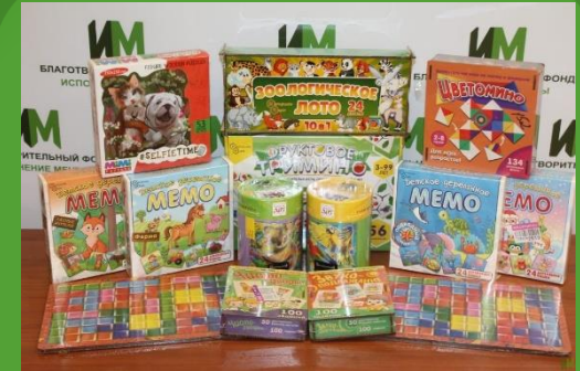
ООО «Нескучные игры» - Игры 14 шт.