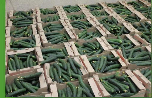
ООО «Тепличный комбинат «Майский»- Огурцы 500 кг.