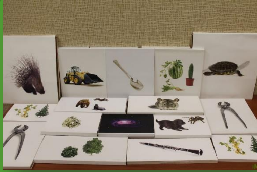
ОЧУ ДПО «Международный институт Монтессори-педагогике» - Наборы Монтессори 26 шт.