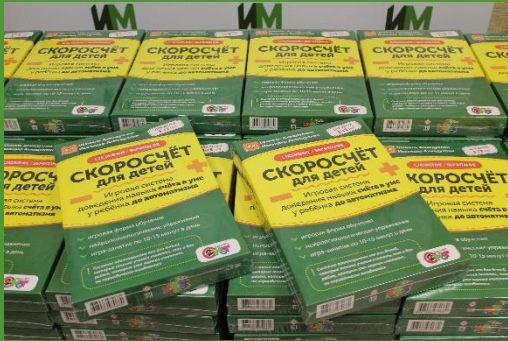
Шамиль Ахмадулин - Скоросчеты 68 шт.