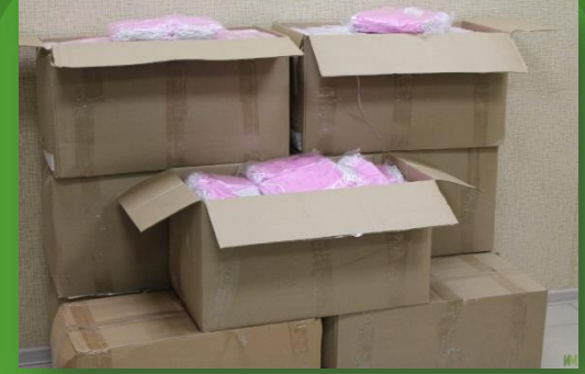
ООО «Лео-Медикал Продакшин» - Одноразовые маски 450 шт.