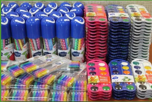
АО «ЗХК «Невская палитра» – Наборы ручек, фломастеров, акварели – 650 шт.