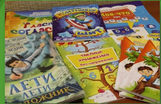
Издательство «Союз писателей» - Книги 19 шт.