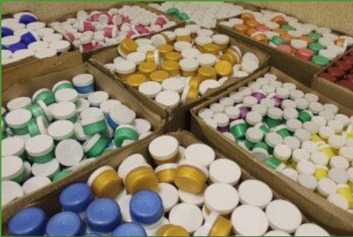
ООО «Колер» – Краски 5595 шт.